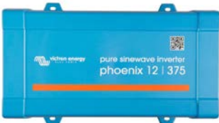
Phoenix 12/375 VE.Direct